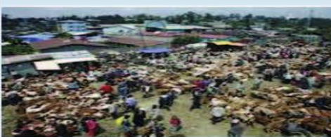
From this type of Life

4EPR is about engaging people to earn a prosperous, healthy and peaceful life