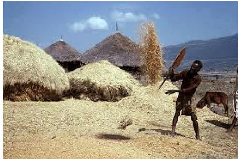
Keeping the stack of Teff for a couple of months makes for a better harvest, Teff farmers believe, and thus scenes like the one seen above are common in most parts of rural Ethiopia.