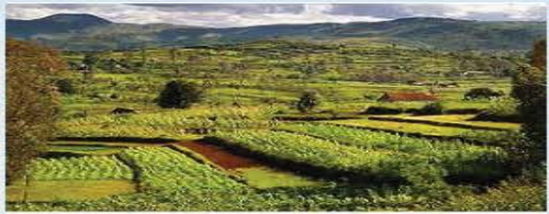
To this kind all over

The website is created based on an upcoming book entitled '4EPR Approach to Sustainable and Expedited Development.'