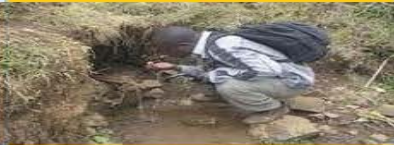
Thirsty school boy is drinking unsafe water - desperate

Updates - News TIBEB Ethiopia offers saving and investment opportunities check here